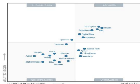
Figura 1: Quadrante mágico do Gartner

A seguir vemos o quadrante mágico do Gartner , uma empresa conceituada no mercado mundial por realizar pesquisas sobre tecnologia, em que vários clientes tomam decisões a partir destas análises (MILO, 2017).