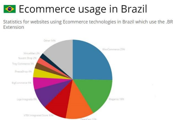
Figura 4: Plataforma mais utilizada no Brasil

Na comparação WooCommerce x OpenCart , ambos são voltados para o cliente que está iniciando, como já vimos anteriormente, ambos são gratuitos, possui temas gratuitos, possuem fóruns com muitos usuários ativos, prontos para te ajudar, porém não possui um suporte da própria plataforma em si.