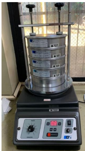
Figura 8: Agitador eletromagnético da Tecnal®, modelo B-AGIT Bertel, instalado no laboratório de Operações Unitárias, Bloco E, UNIUBE Campus Aeroporto.

Foi utilizado o agitador eletromagnético da Tecnal®, modelo B-AGIT Bertel, Figura (8) para efetuar a separação das partículas nas peneiras. Adotou-se um tempo de cinco minutos, a uma escada de intensidade de vibração igual a oito.