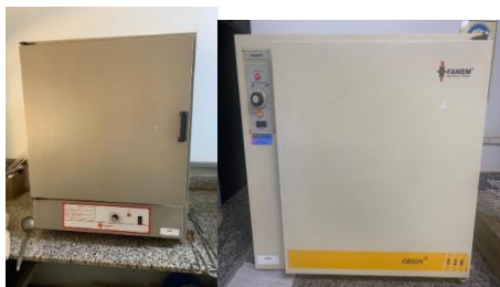
Figura 3: Estufa Quimis® à 105°C, (B242) à esquerda e estufa Fanem® à 105°C, à direita, instalado no laboratório de Operações Unitárias, Bloco E, UNIUBE Campus Aeroporto