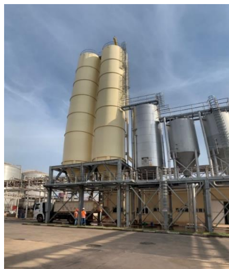
Figura 1: Local de coleta em silos cilíndricos de amostra do bagaço de malte na cervejaria Petrópolis, unidade Uberaba-MG

Vários constituintes, usados na produção da cerveja, técnicas empregadas pela cervejaria, origem dos grãos de cevada e adição de ingredientes, como milho, arroz, aveia e trigo, desempenham um papel fundamental na formulação final desse subproduto (Velasco et al.,2009).