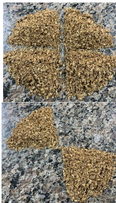
Figura 5: Etapa de quarteamento em amostras secas de resíduo bagaço de malte.

Para obter uma amostra final, é preciso dividir a amostra primária em alíquotas menores. Essa operação é denominada quarteamento, segundo Oliveira et. al (2007). A etapa consiste em divisão sucessiva de uma amostra em duas partes iguais, representando a amostra total. Uma das partes continuará a ser analisada, enquanto a outra parte será armazenada como amostra de reserva/contraprova para caracterização/análise futura, conforme Figura (5). Essa metodologia permite que diversas análises sejam realizadas com maior eficiência e homogeneização. Pode ser realizada manualmente, iniciando o processo com um formato de uma pilha cônica.