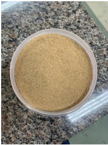
Figura 7: Bagaço de malte após a moagem