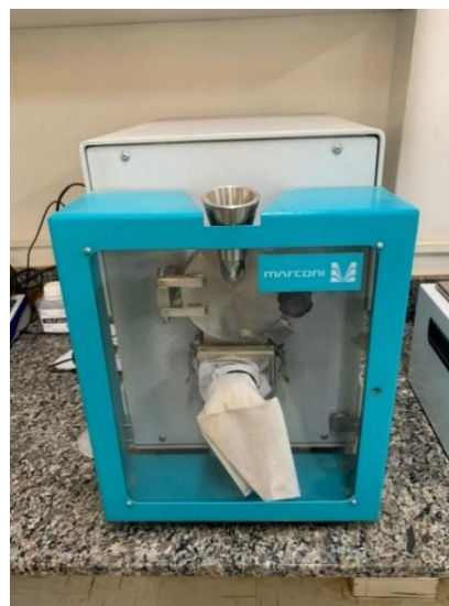
Figura 6: Moinho de facas da Marconi® (MA 600), instalado no laboratório de Operações Unitárias, Bloco E, UNIUBE Campus Aeroporto.

Foi realizada a moagem em um moinho de facas da Marconi® modelo MA 600, Figura (6), com potência de 700 watts, obtendo-se assim, um pó natural, proveniente do resíduo bagaço de malte já seco (Figura 7).