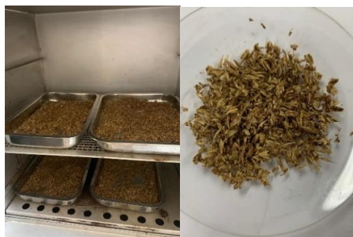
Figura 4: Amostras do bagaço de malte secas na estufa à 105°C.