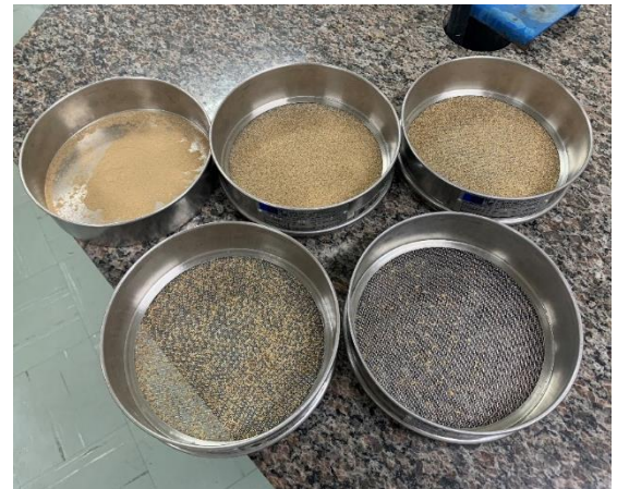
Figura 9: Série Peneiras Tyler 14, 24, 35, 60 com amostras de pó de malte retidas (MSM).

Foi determinado o tamanho para amostras secas moídas (MSM), conforme Figura (9), do resíduo de bagaço de malte. Foram usadas 10 g a 11 g de amostra.