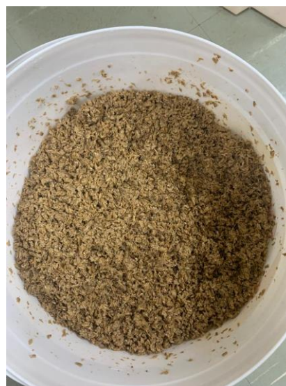
Figura 2: Amostra úmida do bagaço de malte