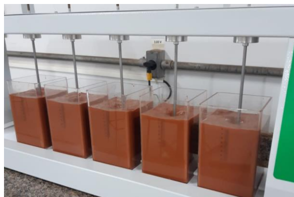
Figura 3: Tratamento do efluente 2 no Jar Test

No primeiro jarro adicionou-se 24 mL e no segundo 28 mL da solução de Tanino 160 g/L. A Figura 3 apresenta o tratamento realizado com este efluente.