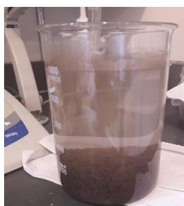
Figura 7: Coagulação do efluente 2 com Sulfato de Alumínio e Hidróxido de Cálcio.

Notas: 1º jarro: 24 mL de Tanino (160 g/L), 2º jarro: 28 mL de Tanino, 3º Jarro: 10 mL de \text{Al}_2(\text{SO}_4)_3 (500 g/L), 4º Jarro: 14 mL de \text{Al}_2(\text{SO}_4)_3 , 5º Jarro: 1 mL de \text{Al}_2(\text{SO}_4)_3 e 10 mL de Tanino.