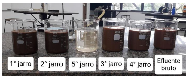
Figura 6: Resultado do tratamento com o efluente industrial 2.

A Figura 6 representa o resultado do tratamento realizado no efluente industrial 2, sendo cada um dos béquers uma amostra (tratada ou bruta). Assim como para o primeiro efluente, a Figura 7 apresenta o resultado do ensaio extra com Sulfato de Alumínio e Hidróxido de Cálcio.