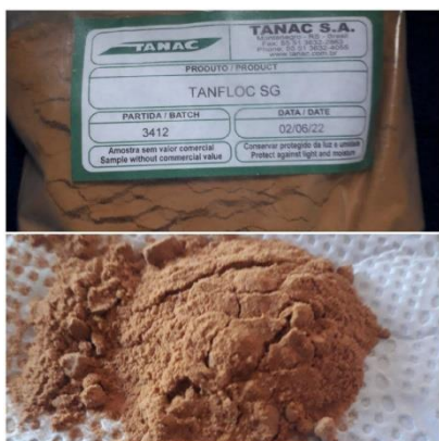
Figura 1: Coagulante natural Tanino de Acácia Negra - TANAC S.A.

Acácia Negra (Figura 1). Esse produto é exclusivamente de origem vegetal e apresenta baixa massa molecular e propriedades coagulantes e floculantes para fins de tratamento (ZOLETT E JABUR, 2013).