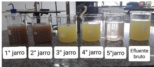
Figura 4: Resultado do tratamento com o efluente industrial 1

A Figura 4 representa o resultado do tratamento realizado no efluente industrial 1, sendo cada um dos béquers uma amostra (tratada ou bruta). A Figura 5, por sua vez, apresenta o resultado do ensaio extra com Sulfato de Alumínio e Hidróxido de Cálcio.