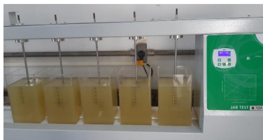
Figura 2: Tratamento do efluente 1 no Jar Test .

nesse estudo permitiram avaliar as eficiências isoladas dos coagulantes e a sinergia entre eles.